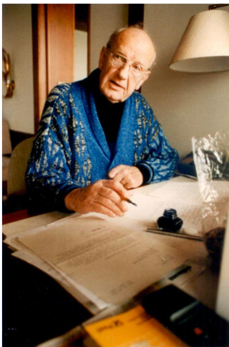
Abb.2: Georg Meistermann 1990